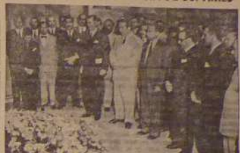
El Gobernador Juan Perón en el momento de la celebración de la C. G. T.