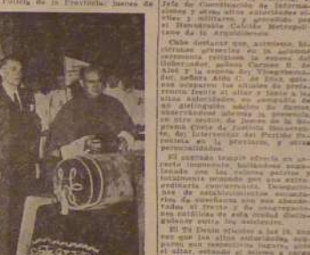
Los miembros del Poder Ejecutivo...